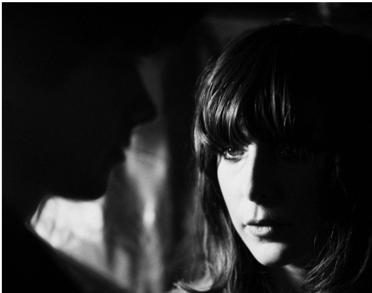
Beach House klonk nooit beter dan op sommige songs van zijn achtste album.

Voor het eerst met strijkers, maar soms ook vanuit akoestische gitaar, is dit het meest genuanceerde album van Beach House: meeslepemde melodieën en lome grooves zijn hun handelsmerk, maar alles zit harmonisch beter in elkaar en Victoria Legrand heeft ruim geïnvesteerd in vocale variaties. Sommige songs duren lang, maar de instrumentale passages dienen het geheel, dat een ode is aan creativiteit en scheppingskracht. En, zoals wel vaker, aan de sacraliteit van de natuur, die gloeit in de atmosfeer en metaforische rijkdom. Hoge ambities, en met brio geslaagd. (vpb)